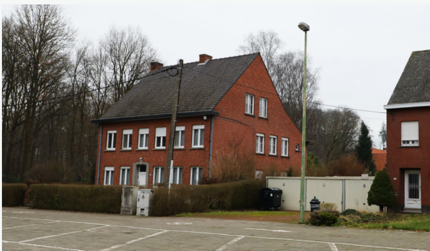
Hogedreef 5, het zusterhuis van Bergom

Ook daar zullen activiteiten worden georganiseerd. Hoe het antennepunt van Bergom er uit zal zien vind je terug op de website van de gemeente. Door de oprichting van het lokaal dienstencentrum willen we de mensen dichter bij elkaar brengen. Eenzaamheid is immers één van de grote problemen van onze tijd. In tijden van corona kwam dit nog meer tot uiting.