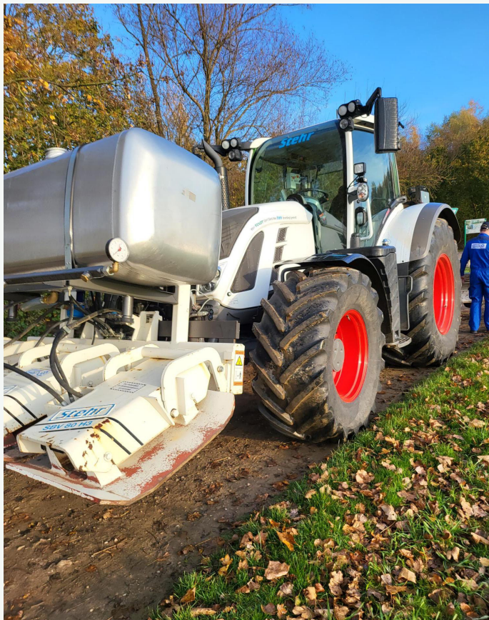
De wegen-herstellende machine in kwestie

De verdere stand van zaken over grote openbare werken, zoals de fietspaden langs de Aarschotsesteenweg en de Dieperstraat kan u volgen via onder meer in “Herselt leeft” en de andere media van het gemeentebestuur.